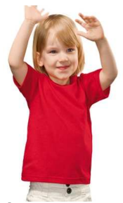
L'estime de soi : un passeport pour la vie !

La troisième composante est le sentiment d'appartenance. Le mot le dit, l'enfant fait partie d'un groupe. Bien avant de faire partie de « la gang » de son service de garde, il fait partie d'une famille. Il est donc important de valoriser ce fait et de ne jamais dénigrer ses parents. Même si, il arrive qu'ils oublient les mitaines de temps à autre... l'enfant est la moitié de papa et de maman : ne l'oublions pas! Tout commentaire le touchera directement.