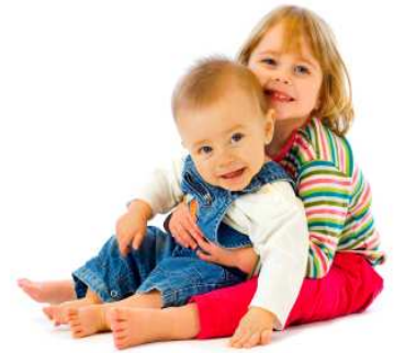
Le sentiment de sécurité : essentiel pour favoriser l'estime de soi chez l'enfant